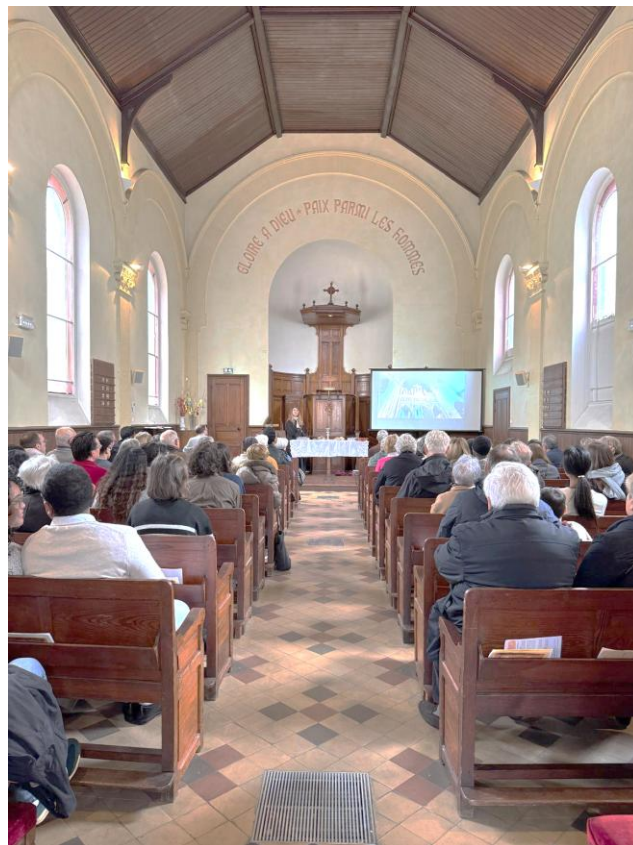
Culte de Pâques (avec la participation de la pasteure Patience Sela-Ewane, et de la chorale)